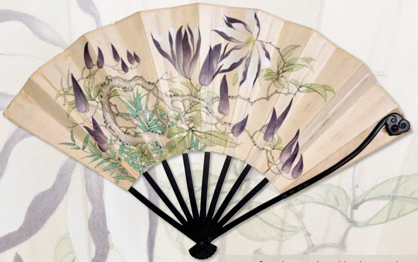
11. Les fleurs de Xinyi, Chine, début du XIX e siècle Éventail plié, la feuille double en papier peint de grandes fleurs de magnolias, « xinyi » en chinois. Le revers orné de caractères calligraphiés à l'encre de Chine, sur fond de fragments de feuilles d'or, d'un poème sur dix fleurs pour dix amis, par le poète Ruan Yuan 阮元 (1764-1849), calligraphe et lettré célèbre de la dynastie Qing. Cachets rouges à gauche. Monture en bois noir, le haut des panaches sculptés en sceptre Ruyi, symbole de bonheur, et incrustés de fils d'argent et d'une demie pierre rouge. Les deux panaches présentent également les caractères calligraphiés « 吉祥如意 » pour « bonheur » en argent incrusté. 1.500/2.000€