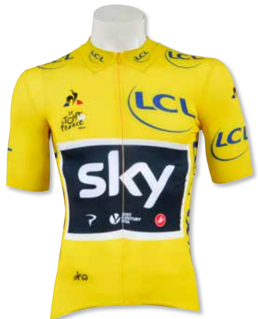
271 Christopher Froome . Maillot Jaune du Tour de France 2017. Sa 4 ème victoire dans l'épreuve. Marque Le Coq Sportif. Taille M (avec le liseré Tricolore dans le dos). 400 / 600 €