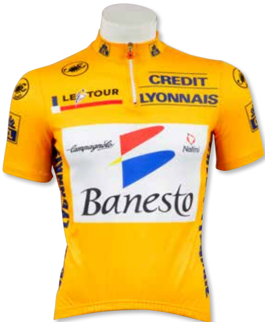
228 Miguel Indurain . Maillot Jaune de leader du Tour de France 1994. Il remporte sa 4 ème victoire dans l'épreuve. Marque Castelli. Taille 4. 400 / 600 €