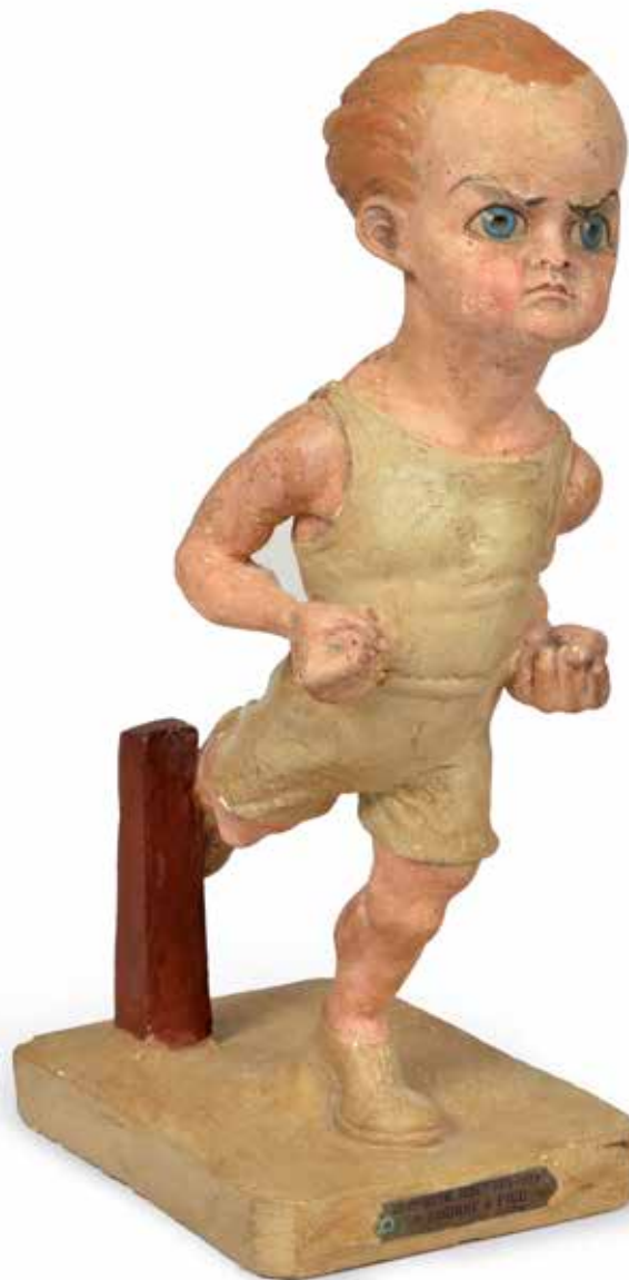
10 PARIS 1924. Statuette en plâtre. «La Course à pied». Par Coffin. Plaque en laiton gravée VIII ème Olympiade Paris 1924. Hauteur 27 cm. État d'usage. 200 / 300 €