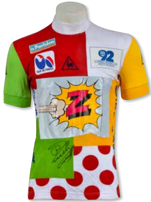
221 Gilbert Duclos-Lassale . Maillot podium de leader du classement du combiné porté sur le Tour de France 1987 avec l'équipe Z. Marque Le Coq Sportif. Signature du coureur sur le devant. 600 / 800 €