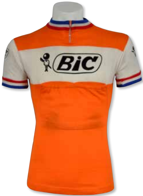
197 Jacques Anquetil . Maillot porté lors de la saison 1969 avec l'équipe BIC. Liserés de Champion de France de poursuite. Ce sera la dernière saison de la carrière du Champion, quintuple vainqueur du Tour de France. En laine. Taille 3. 2 000 / 2 500 €