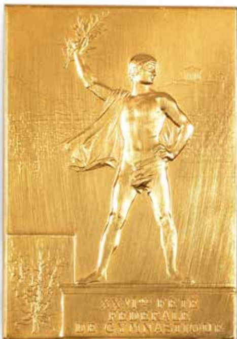
6 PARIS 1900. Plaquette en vermeil. «XXVI ème fête Fédérale de Gymnastique» Par F. Vernon. Argent plaqué or. Poids 55 grs (poinçon). Dans sa boîte d'origine. 800 / 1 200 €