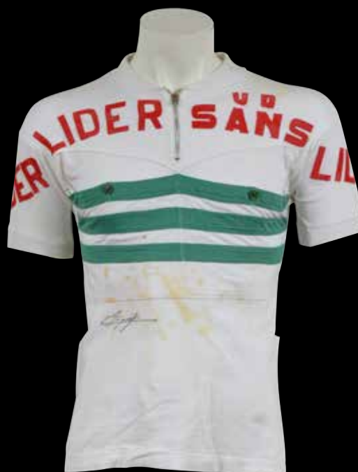
193 Jacques Anquetil . Maillot de vainqueur du Tour de Catalogne 1967 au cours duquel il remporte le Contre-la-montre.

Signature sur le devant opposée avec son cachet personnel. Rare pièce de musée. 4 000 /6 000 €