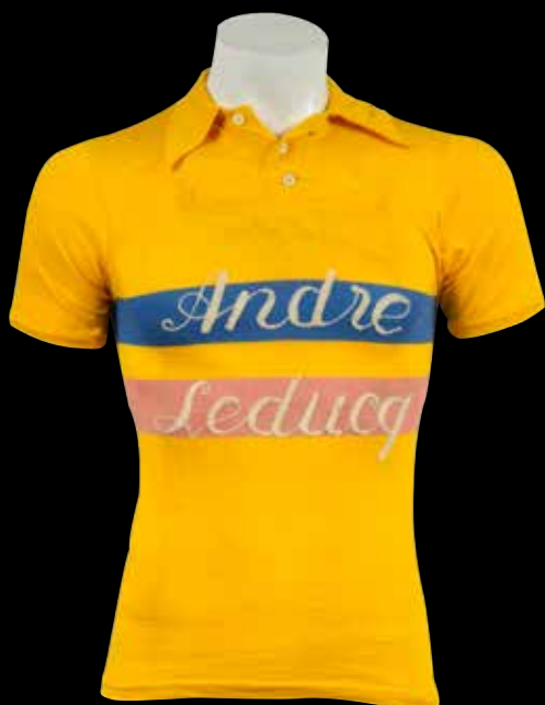
188 Maillot de l'équipe André Leducq porté par les coureurs lors de la saison 1934. Marque Unis-Sport. Rare. Bon état. 800 /1 000 €