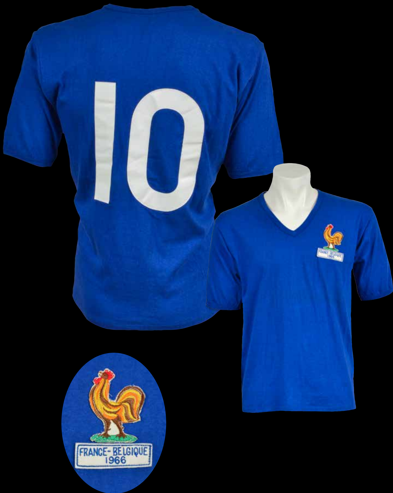
382 Jacky Simon . Maillot N°10 de l'équipe de France pour la rencontre internationale face à la Belgique le 20 avril 1966 au Parc des Princes. Victoire des Belges 3-0. Le joueur aura 15 sélections en équipe de France et marquera 1 but. Marque Allen Sports. Taille 4/5. 4 000 /6 000 €