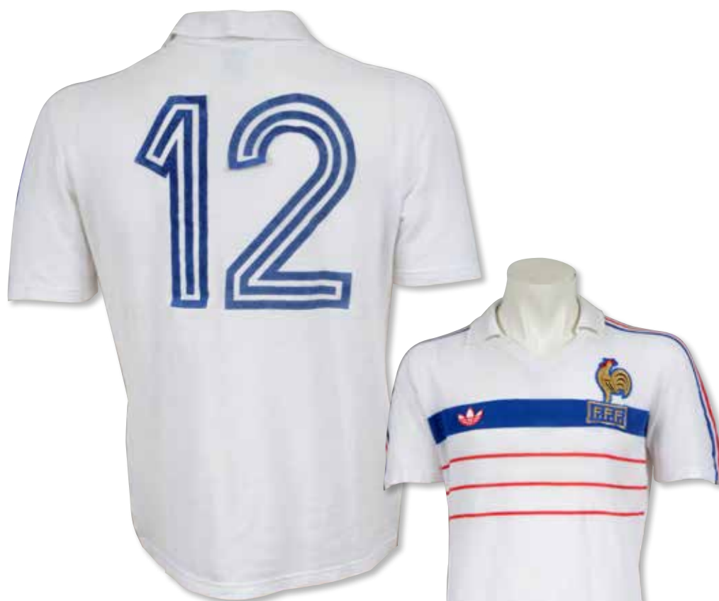
313 Alain Giresse. Maillot N°12 de l'équipe de France pour la rencontre du Championnat d'Europe face à la Belgique le 16 juin 1984 à Nantes. Victoire des Bleus 5-0 avec un triplé de Michel Platini. Marque Adidas. Modèle Ventex. Taille 4/5. Collection Henri Guérin.