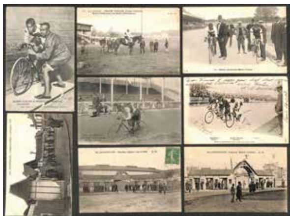
126 Major Taylor. Ensemble de 5 cartes postales du sprinteur américain. On y joint 2 cartes du Vélodrome de Buffalo à Montrouge lieu de ses nombreux exploits. Rare ensemble. État d'usage. 800 / 1 000 €