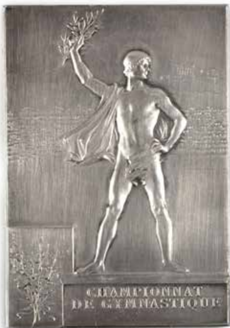
5 PARIS 1900. Plaquette en argent. «Championnat de Gymnastique». Par F. Vernon. En argent. Poids 54 grs. (poinçon). Dim. 42x60 mm. 400 / 600 €