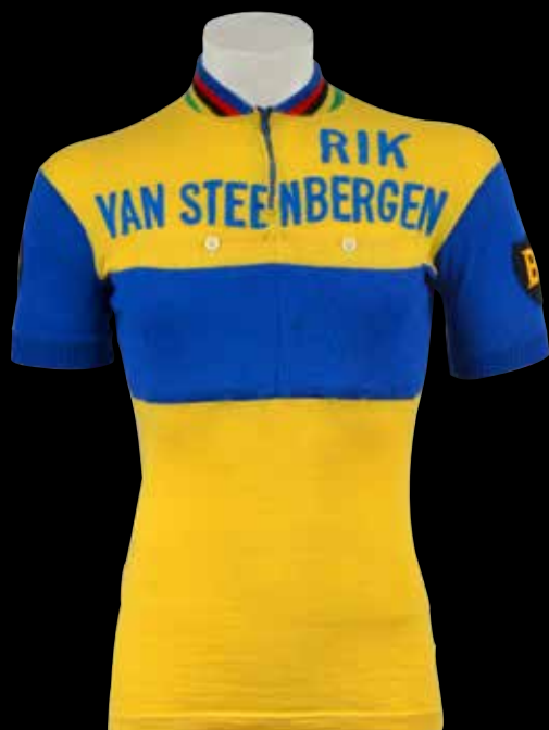
191 Rik Van Steenbergen . Maillot de Critérium avec liserés de Champion du Monde. Équipe Peugeot-BP-Dunlop pour la saison 1960. Triple Champion du Monde 1946-1956 et 1957, vainqueurs de 8 classiques, 25 étapes sur les Grand Tours, il totalise 1053 victoires durant sa carrière. L'un des plus grands champions de tous les temps.