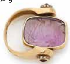
104 BAGUE en or 18K (750), ornée d'un chaton pivotant serti d'une améthyste gravée d'un côté d'enfants jouant de la flûte, de l'autre de rameaux de prunus, l'épaulement agrémenté de rubis cabochons et de diamants. Tour de doigt : 47. Poids brut : 17,3 g 700 / 800 €