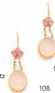
108 PAIRE DE PENDANTS D'OREILLES en or 18K (750), chacun orné d'une tourmaline rose facettée et d'un quartz rose cabochon. Hauteur : 3,5 cm environ. Poids brut : 4,3 g 200 / 300 €