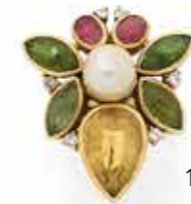
106 BAGUE en or 18K (750) représentant une abeille stylisée, le corps en perle de culture et en citrine, les ailes serties de péridots, la tête en tourmalines roses, les yeux piqués chacun d'un diamant. Hauteur de l'abeille : 3 cm environ. Poids brut : 13,3 g 600 / 800 €