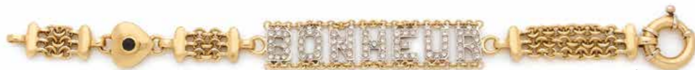
105 BRACELET en or 18K (750), orné d'un cœur agrémenté d'un saphir cabochon, portant l'inscription BONHEUR, les lettres serties de diamants ronds de taille brillant. Travail des années 1980. Longueur : 18,5 cm environ. Poids brut : 31 g 900 / 1 000 €