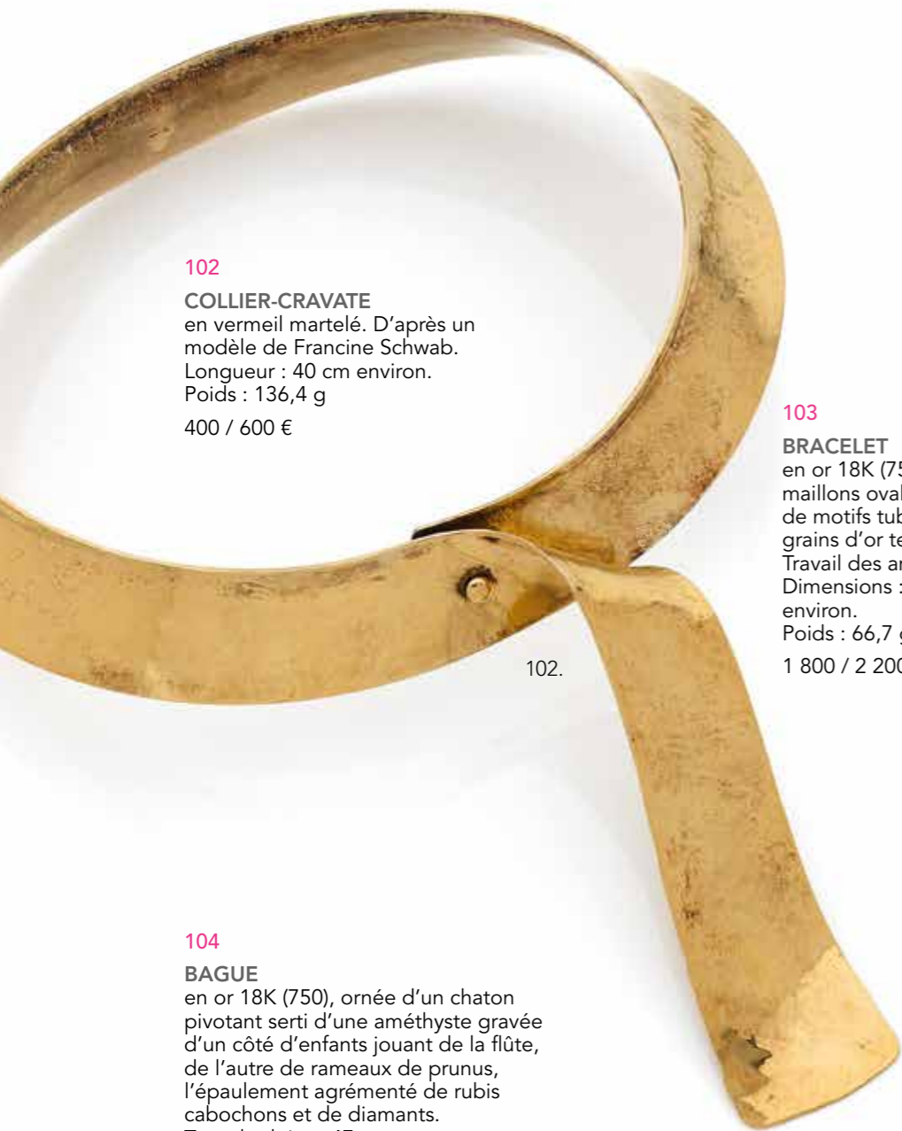
102 COLLIER-CRAVATE en vermeil martelé. D'après un modèle de Francine Schwab. Longueur : 40 cm environ. Poids : 136,4 g 400 / 600 €