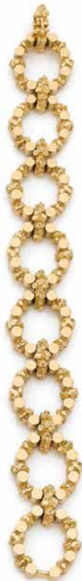
103 BRACELET en or 18K (750), articulé de maillons ovales composés de motifs tubulaires et grains d'or texturé. Travail des années 1970. Dimensions : 19 x 2 cm environ. Poids : 66,7 g 1 800 / 2 200 €