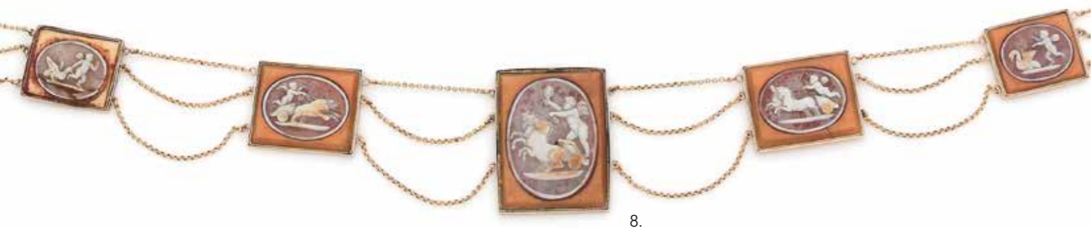
8 COLLIER de 3 chaînettes d'or 18K (750) scandé de motifs rectangulaires de taille croissante sertis de camées coquilles sculptés de putti sur fond de verre. Travail du premier quart du XIX e siècle. Longueur : 35 cm environ. Poids brut : 20 g (accident, transformation) 800 / 1 200 €