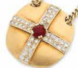
107 PENDENTIF de forme coussin en or 18K (750) satiné, orné d'un grenat dans une croix de diamants ronds de taille brillant, coulissant sur une chaîne en or 14K (585). Dimensions : 3,2 x 3,2 cm environ. Poids brut : 39,2 g 1 400 / 1 800 €