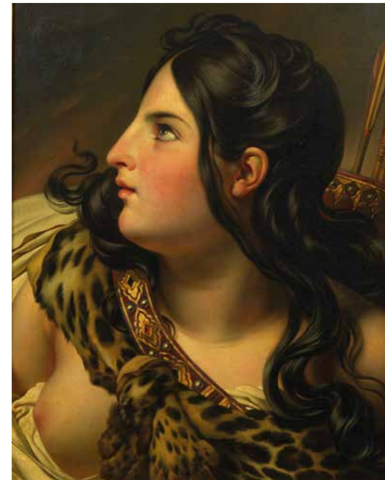
Anne-Louis GIRODET de ROUSSY-TRIOSON (1767-1824) Amazone Huile sur toile 56 x 46, 5 cm

Exposition Girodet, Paris, Chicago, New York, Montréal, 2005-2007.