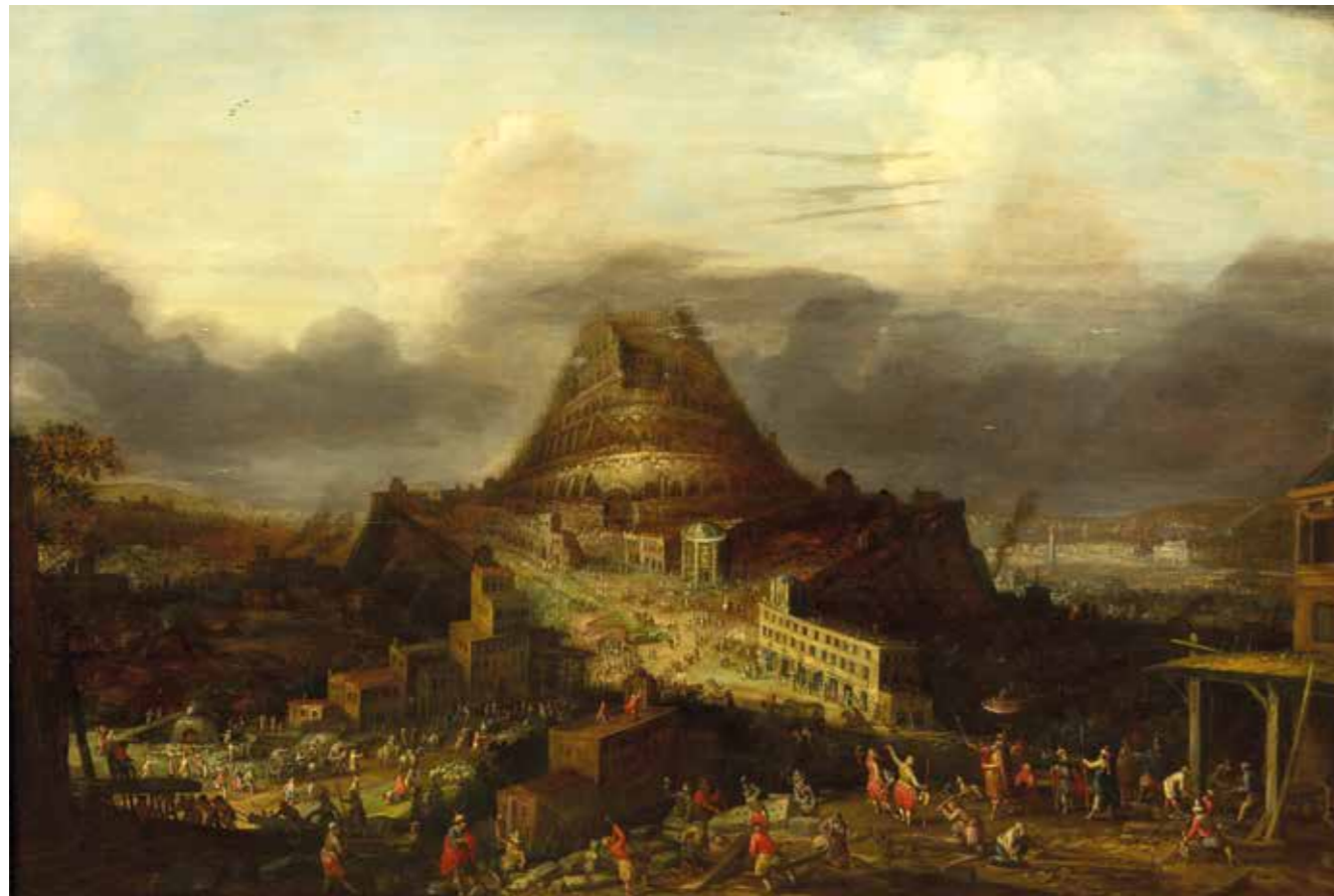
Hendrick III VAN CLEVE (1525-1589) La Tour de Babel Huile sur panneau, parqueté 76 x 108 cm