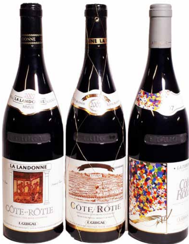
Lot 382 - Trilogie Côte-rôtie 2007 magistrale. 3 parcelles, vigneron légendaire, M. Guigal